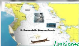
Ambiente e cultura